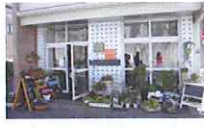
【池之端近くのフラワーカフェ】 BLANCHEUR Cafe(ブランシュールカフェ) 根津から上野へ抜ける裏道は、上野動物公園の木々に囲まれた癒しスポット。

そ〜って夜の癒しのお店で東京支店...いや!! (株)カタヤマの我が家のような癒しの場所...「居酒屋 大将川」 大将は、汗ダラダラ&チャームングな笑顔でいつもあたたかく迎えてくれ、弊社のこの社内報も店内に貼ってくださいます。雨の日も風の日も店先にお客様を迎える姿には頭が下がります。東京へいらした際には是非、支店スタッフとともに心をやわらかにゆきませんか。