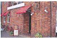
【千駄木駅前の老舗カフェ】 珈琲千駄木倶楽部 店内はフランスの田舎風。